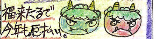
福来ると今年厄払い