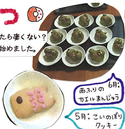
6月: 雨ふりのカエルまんじゅう