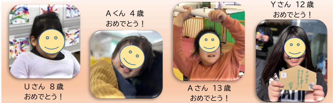
Aくん 4歳 おめでとう！