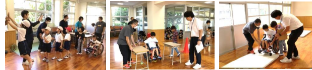
ウィールチェアー九州支店様、ライフプラスりはなす様が車いすを提供してくださりました。ありがとうございました！

ベストグループは、9月29日に飯塚市内の小学校で小学1年生を対象に 車いす体験教室 を開催しました！この取組みはチェリーに通所している車いすユーザーの児童さんがこの小学校に就学した事がきっかけで実現しました。先生方からは、 車いすユーザーへのかかわり方や、車いすに乗っている人の気持ちや困りごとを生徒皆に知ってほしい とのことで、私達にご相談してくださいました。色々な人にとって暮らしやすい社会の実現のための第一歩！みんなで「 合理的配慮 」を学んだ貴重な時間でした！