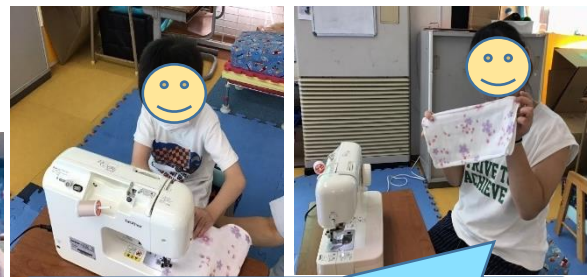
みてみて！ミシンで雑巾を縫ったよ！！